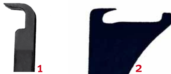
Ausschnitt Werkzeug 1 und 2

Den Kennzeichenhalter unter Ausnutzung der vorhandenen Lochbohrungen am Fahrzeug mit Unterlegscheiben (Ø 20 mm) befestigen.